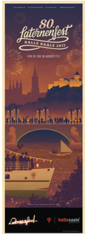
Gewinnerplakat zum 80. Laternenfest der halleschen Agentur Logoversum (Tobias Büttner & Nick Härtling GbR) unten: Foto Thomas Ziegler/ Stadtmarketing Halle (Saale) GmbH