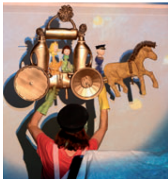
15.09., 15 + 19 Uhr „Violett“ Bühnenkomposition von Wassily Kandinsky, Großes Haus Dessau