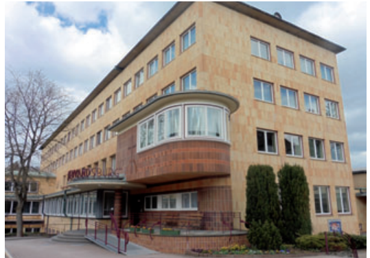
Das im Stile des Bauhaus errichtete Diakonissen-Mutterhaus in Elbingerode

Im Rahmen einer Führung oder Besichtigung können Mahlzeiten (z.B. Mittagessen oder Kaffee und Kuchen) für eine Tagesgruppe dazu bestellt werden. Mahlzeiten, die während eines Aufenthaltes in unserem Gästehaus Tanne gewünscht sind, werden über die