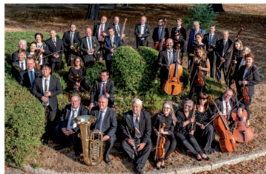
Die Harzer Sinfoniker

eine der bezauberndsten und witzigsten Tierkunden in musikalischer Gestalt. Ob Löwen, Schildkröten, Elefanten und Kängurus, ob Esel, Huhn, Kuckuck und Schwan oder aber so merkwürdiges Fantasie-Getier wie Fossilien und Pianisten (oder Tastentiere): jede Spezies wird in prägnanten wie witzigen musikalischen Stimmungs- und Klangbildern charakterisiert, was Kindern das Verständnis klassischer Musik erleichtern und als charmanter wie lehrreicher Führer durch die verschiedenen Stimmgruppen des Orchesters dienen kann. Sie können nicht genug vom