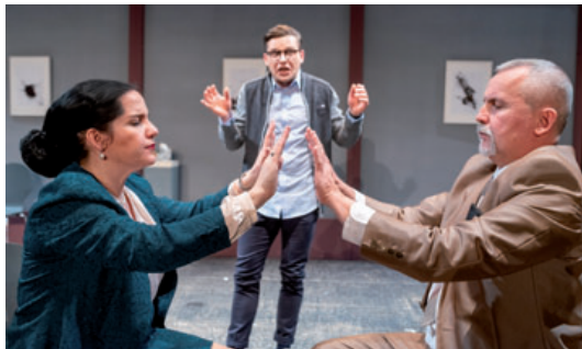
Komödie „Die Wunderübung“

Die Harzer Sinfoniker bieten in ihren vielfältigen Konzertformaten ebenfalls eine faszinierende musikalische Wandlungsfähigkeit, die von Beethoven bis zur Orchesterwerkstatt, vom konzertanten Opern-Akt bis zum Neujahrskonzert und den Klangwogen des abschließenden Gemeinschaftskonzertes im Halberstädter Dom reicht. Camille Saint-Saëns' „Der Karneval der Tiere“, unser diesjähriges Schülerkonzert, ist zweifellos